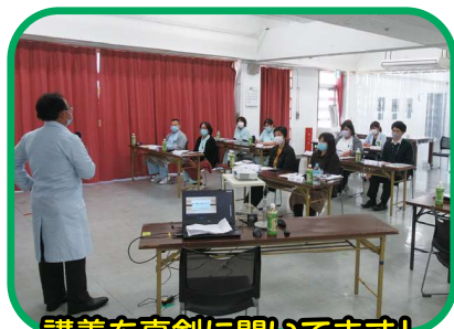
講義を真剣に聞いてます!