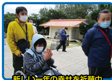
新しい一年の幸せを祈願中