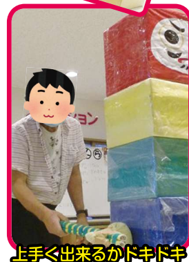
上手<出来るかドキドキ