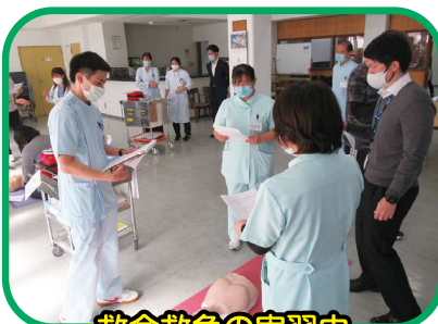
救命救急の実習中