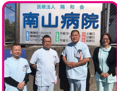
左から上野看護部長・山城副部長・大城副部長・山城顧問