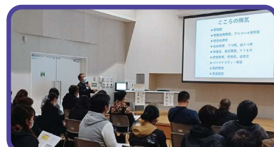
多くの方にご参加いただきました