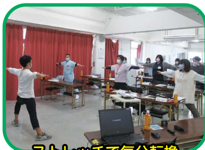
ストレッチで気分転換