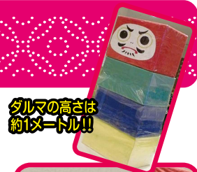
ダルマの高さは約1メートル!!