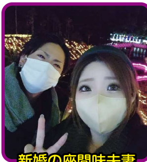
新婚の座間味夫妻

名護で何かイベントがあっても帰るのが大変ですので、リゾネックス名護に宿泊し、美ら海水族館に行ったり、昨年のクリスマスは東南植物楽園を気軽に楽しむ事が出来ました。夏場のホテルのビーチも最高です！ちなみに、一緒に旅行を楽しく過ごした相方が去年妻になりました。