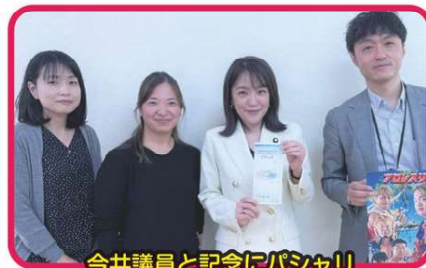
今井議員と記念にパシャリ