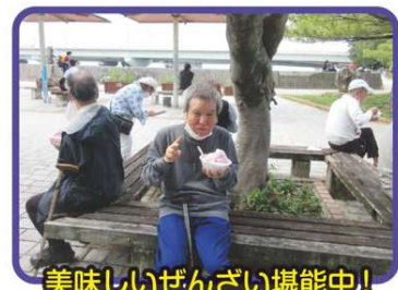
美味しいぜんざい堪能中！