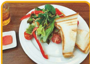
取れたて野菜は新鮮で美味しかったです！