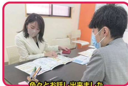
色々とお話し出来ました