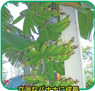
立派なバナナに成長

私たちは利用者のこれまでの人生を想像しながら馴染みのある活動を提供し、心地よい居場所作りや自発性の向上を図ることをこれからも心掛けていきたいと思っております。