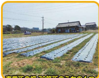
事業所の畑70箇所の中の1つ