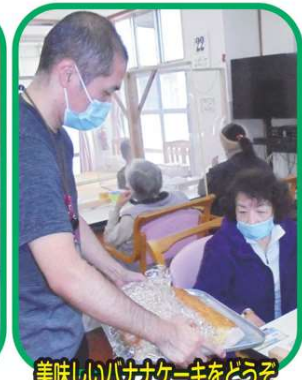
美味しいバナナケーキをどうぞ