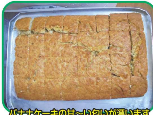
バナナケーキの甘～い匂いが漂います