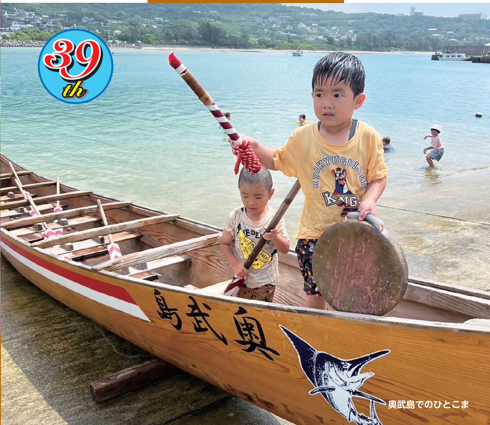
奥武島でのひとこま

2023年8月1日をもって当院は39周年を迎えることができました。 9月15日には第39回「盆踊りの夕べ」を開催します。