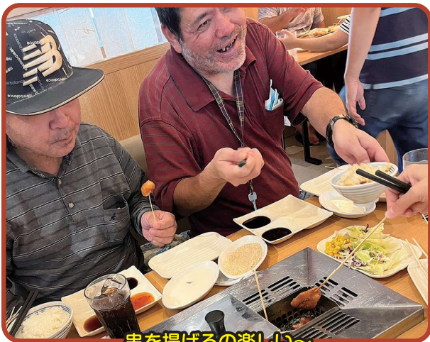
串を揚げるの楽しい~