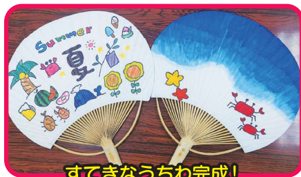
すてきなうちわ完成!