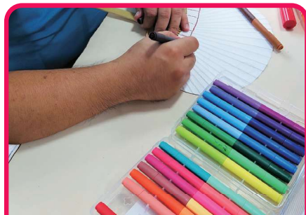
たくさんのカラーペンで描きました