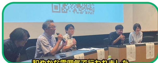
和やかな雰囲気で行われました