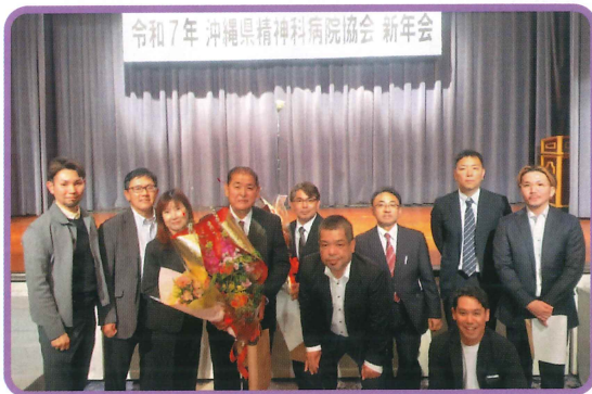
陽和会メンバーと記念撮影