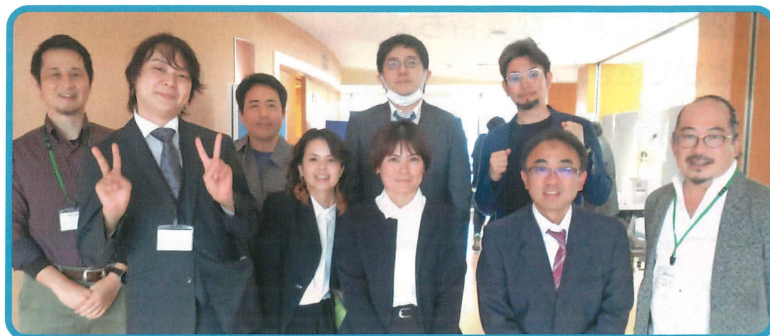
先生方にも見守っていただきました