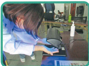
手洗いチェッカーで正しい手洗い方法も学びました