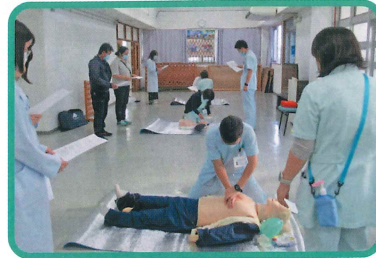
心肺蘇生法の実技